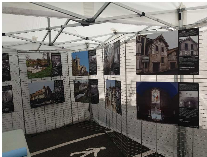
Présentation de l'exposition au Festival international du journalisme de Couthures-sur-Garonne – Juillet 2019