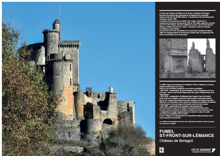
Exemples de panneaux

La plupart des clichés a été réalisée spécialement pour cette exposition par le photographe professionnel Thierry BRETON , établi à Agen. En 2018, il a déjà eu l'occasion d'exposer ses photographies au cinéma Les Montreurs d'images à Agen (série sur l'Inde) et à la galerie d'art La Manufacture générale à Agen (série de clichés réalisée à l'Usine Metal Temple de Fumel).